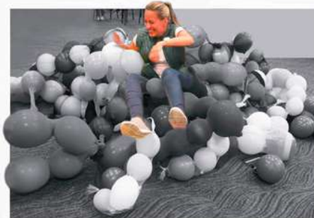
V Congreso Internacional Buen Comienzo (Medellín-Colombia, 2019)