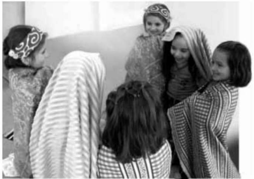
Imagen 1. Niñas disfrazadas mirándose al espejo. CEIP Pablo Picasso (Parla, Madrid)

Quizá se piense que el niño ya juega en su casa y que con eso puede ser suficiente, pero las condiciones del juego simbólico varían dependiendo de los contextos en los que se desarrolla y la escuela no debe autoexcluirse de la oportunidad de ofrecer al niño posibilidades interesantes de juego, teniendo en cuenta que esta institución es, además, el lugar de encuentro por excelencia de grupos de iguales con los que se puede compartir el juego, ya que en el ámbito familiar se reduce, cada vez más, el número de niños. Como dice Vicenç Arnaiz: «El juego simbólico lo trajeron los niños a la