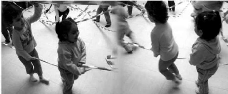
Imagen 2. Niñas jugando al caballito con una cinta. Escuela Infantil Zaleo (Madrid)