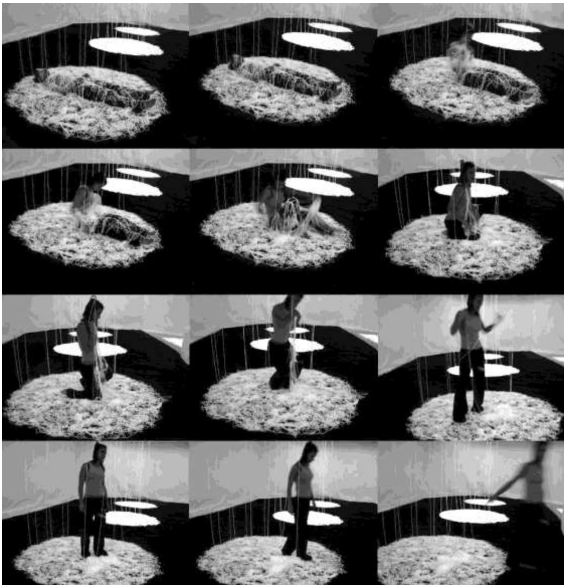
Secuencia de imágenes de representación del renacimiento en la performance. Foto: Javier Abad (2006).

La videoinstalación “El hilo invisible” pretende construir una escenografía para el juego estético y una nueva percepción de objetos y personas mediante elementos como la luz negra, la temperatura, el contraste de los hilos blancos que dibujan nítidamente las acumulaciones horizontales en la penumbra de la sala, el espacio sonoro creado a través del vacío y una cierta sensación de desorientación espacial si se permanece demasiado tiempo en su interior. La presencia de la imagen del vídeo en bucle continuo (un hilo de lana blanca que cae lentamente sobre un fondo oscuro y crea una maraña o dibujo aleatorio) aporta un elemento constante y monótono, sin argumento definido, pero importante en la configuración del sentido temporal de la instalación (a modo de “reloj de arena”). Siempre existe el movimiento y algo está ocurriendo, aunque la habitación permanezca vacía de espectadores.