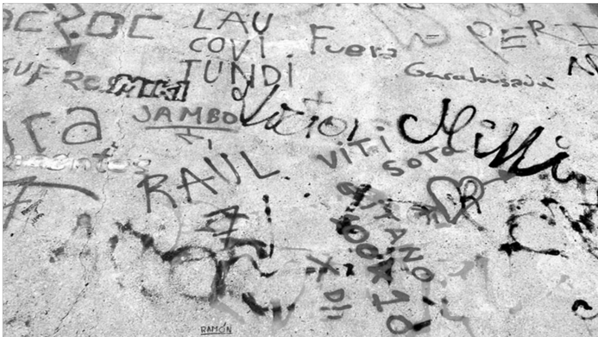
Texto colectivo realizado mediante la superposición de firmas y graffitis.

Así, las palabras son el significado y significante que permite compartir el eco de la conciencia y de la memoria. Las palabras, como estructura de pensamiento, han de abrirse camino en el mundo como herramienta para conocernos a nosotros mismos y a los demás. Y para saber que no “estamos solos” en el acto de la comunicación.