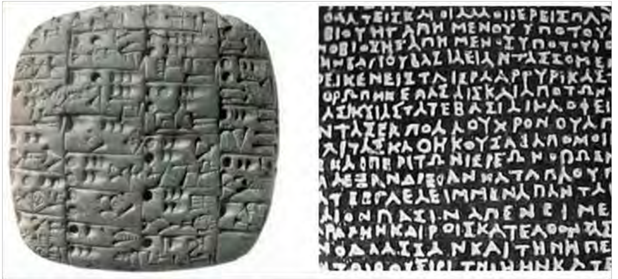
La escritura como “memoria”. Tabla cuneiforme sumeria y fragmento de la piedra Roseta.