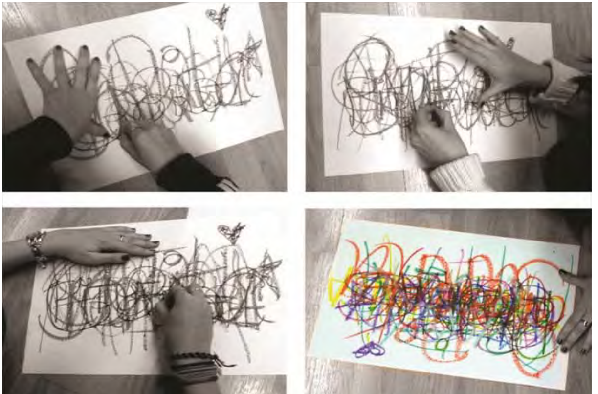
“La firma colectiva” (2011). Performance para diluir el “yo” en el “nosotros” (texto comunitario).